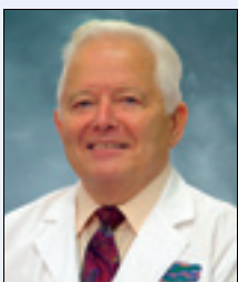
Ivar Mjør Professor, USA

Formålet med sekvensen er å gi informasjon om praksisbasert klinisk forskning. Praksisbasert forskning, dvs. forskning i vanlig, dagligdags tannlegepraksis ved innsamling av informasjon etter oppsatt plan, har kommet i sentrum hva angår klinisk forskning både i Skandinavia og i USA. Hensikten er å trekke klinikerens problemer og erfaringer inn i prioriteringen av forskningsoppgaver samt å forsøke å løse reelle problemer man står overfor i generell praksis.