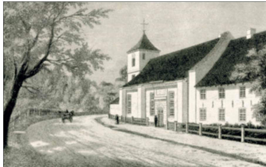
Oslo Hospitals kirke. Tegning fra midten av 1800-årene.

OSLO HOSPITALS HISTORIE • Sykehus, gamle hjem eller fattighus, dvs. steder hvor et større antall mennesker måtte forsørges og pleies, kom først etter at kirken hadde festnet sin organisasjon og klostersvesenet hadde vunnet innpass i Norge. Klostrene selv tjente som oppholdssted for gamle og svake, men ikke først og fremst for de fattige. Folk kunne kjøpe seg underhold i et kloster ved å donere eiendom. Etter hvert ble det også opprettet egne anstalter for fattige gamle og syke, dels grunnlagt av klostre og geistlige, dels av verdslige stormenn eller av kongen. Anstaltene kaltes «hospitaler». Det økonomiske grunnlaget var jordegods som ble ervervet ved arv og gaver. Det fantes flere hospitaler i Oslo i middelalderen. Etter reformasjonen ble de tilhørende jordeieendommene statens gods, men funksjonen ble den samme. Ved kongebrev av 1538 ble Gråbrødreklosteret, like under Ekebergåsen, med kirke og tilliggende eiendom, omgjort til hospital. Betegnelsen «Gråbrødre» henstilte på franciskanernes klesdrakt.