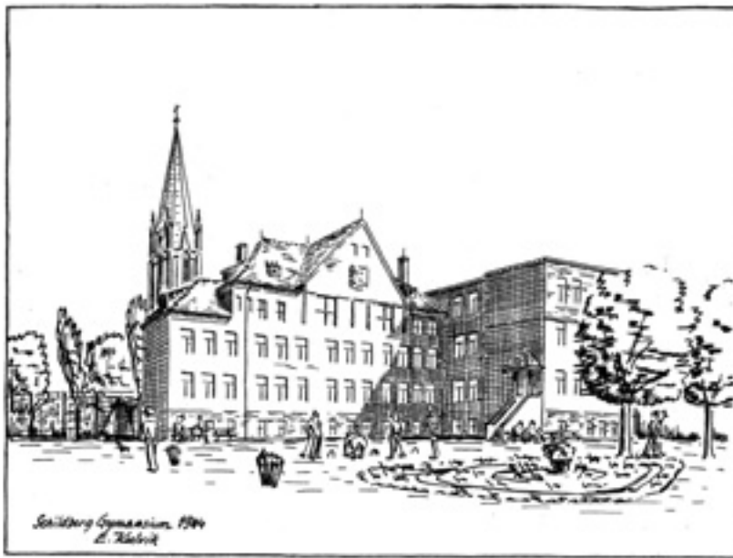
Gymnasium, Schildberg (E. Kulvik).

fra Oslo og Østfold-området. Videre var det én fra Arendal, én fra Stavanger, to fra Bergen, en fra Lillehammer og én fra Harstad.