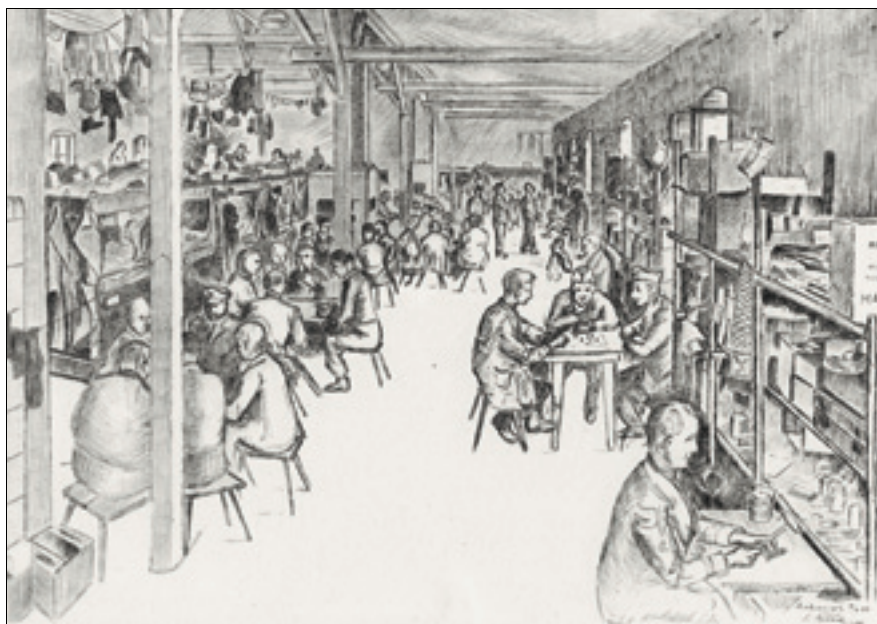
Interiør fra Luckenwalde (S. Tysland).

11. juli 1944. Har laget stifttann nr. 8 i dag.