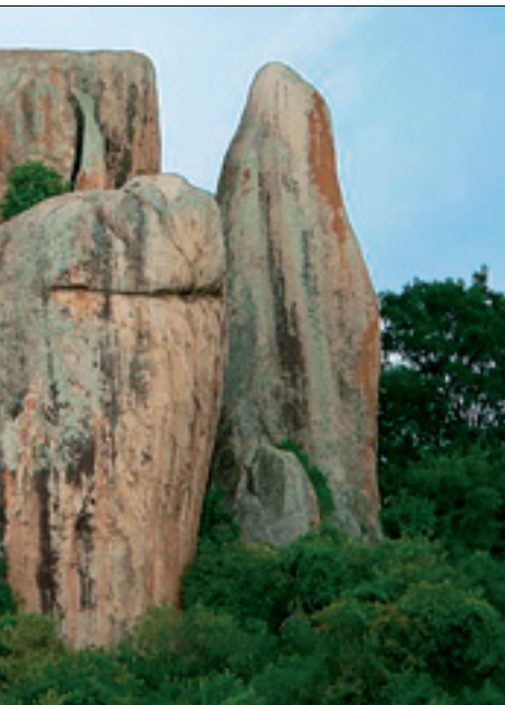
området rundt Haydom.