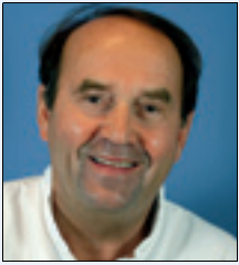
Jarl Arvid Bunæs