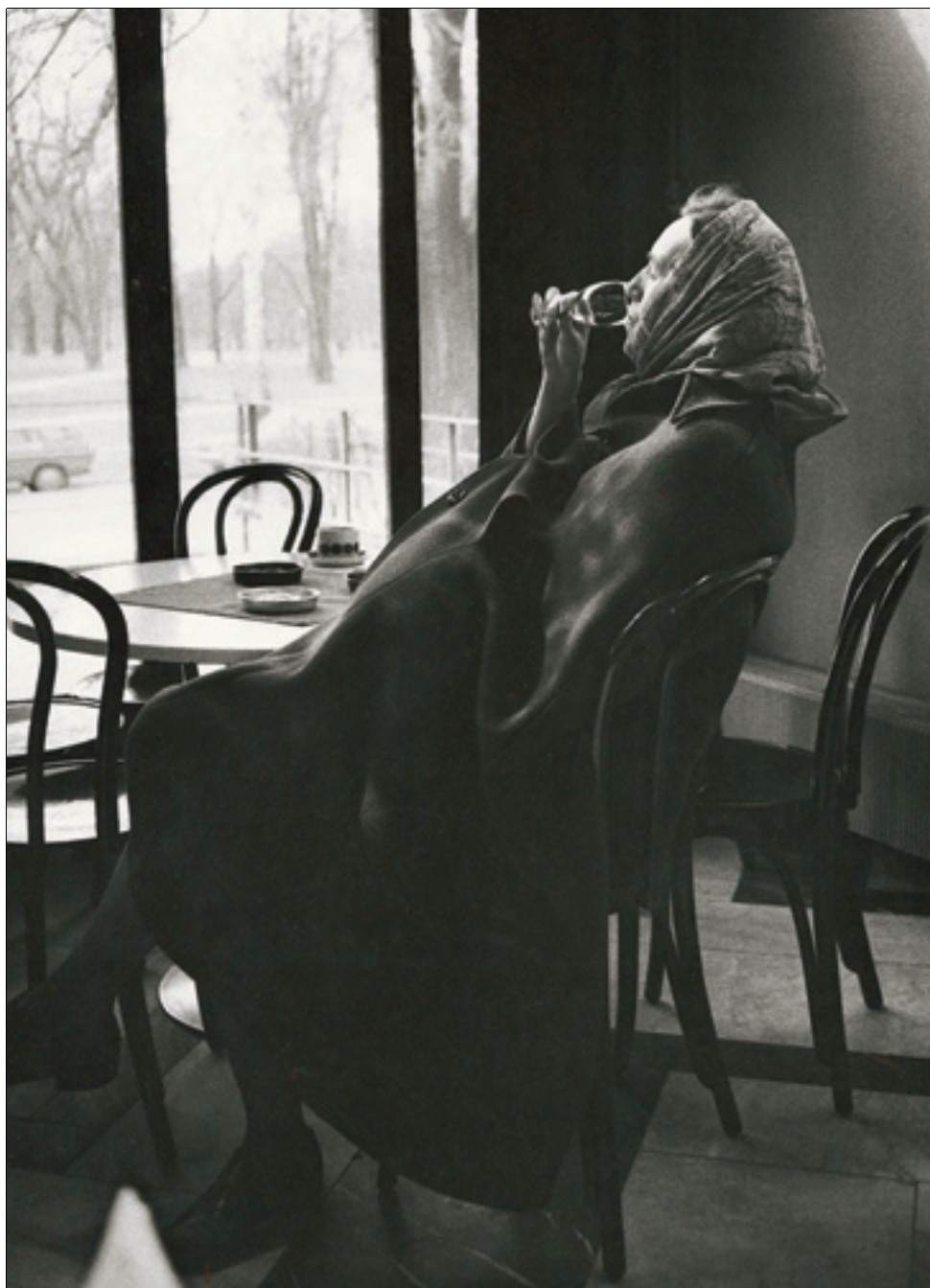
Oslo, Huset 1970.