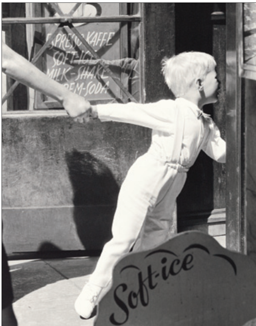
Oslo, Mølhusen 1954.