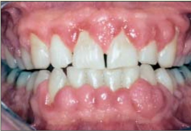
Fig. 4. 32-årig man 2 år efter njurtransplantation. Tandköttshyperplasi i anslutning till cyklosporin- och felodipinmedicinering.

inte någon speciell risk för framskridande parodontit men den lokala etiologiska belastningen är avsevärt förhöjd.