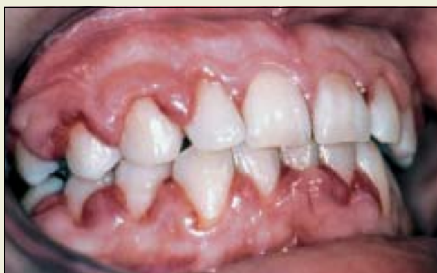
Fig 3. 32-årig kvinna med akut leukemi. Ödemisk förtjockning av tandköttet på grund av leukemisk infiltration.

Neutropeni kan vara en ärftlig eller idiopatisk, ibland förvärvad, störning i produktionen av leukocyter som också kan vara förknippad med en kompensatorisk monocytos. Neutropeni kan också förekomma cykliskt. Då sjunker antalet neutrofila leukocyter mycket lågt (ofta under 500/mm 3 ) för att sedan återgå till ett suboptimalt värde i cykler, ofta inom cirka 3–4 veckor. Ofta varierar antalet övriga leukocyter och trombocyter i samma cykel. När mikrobretningen inte kan behäskas och/eller den cykliska neutropenin är grav är tandköttet ödemiskt, rött och blöder lätt. Under sådana betingelser kan också nedbrytningen av parodontalvävnad framskrida märkbart redan under ett år (20). I svårare fall kan man hitta lokala ulcerationer och vävnadsnekros i den marginala tandköttskanten samt i papillområden. Neutropena ulcerationer förekommer typiskt också på slemhinnorna. Ett flertal undersökningar har visat att man med framgång kan förhindra parodontala skador om man eliminerar plack och andra irriterande faktorer noggrant. Terapin omfattar regelbunden depuration av en professionell person före neutropeniskedet.