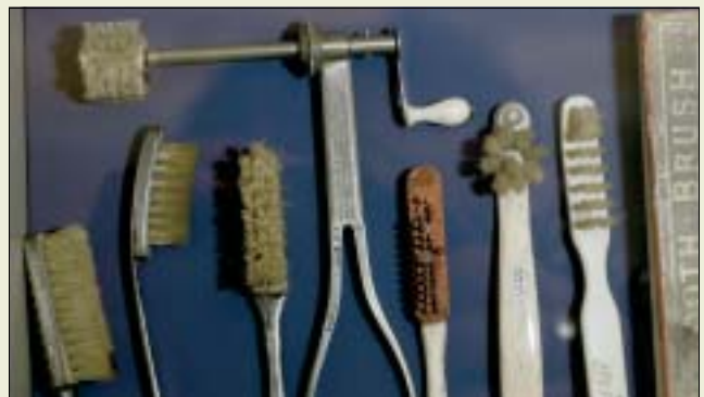
Fra 1800-tallet og til vår tid er det presentert et virvar av forskjellige tannbørster.