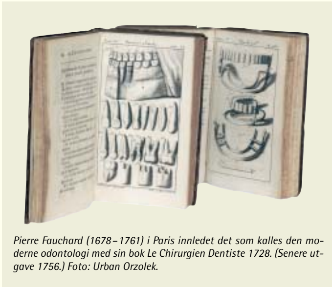
Pierre Fauchard (1678–1761) i Paris innledet det som kalles den moderne odontologi med sin bok Le Chirurgien Dentiste 1728. (Senere utgave 1756.)