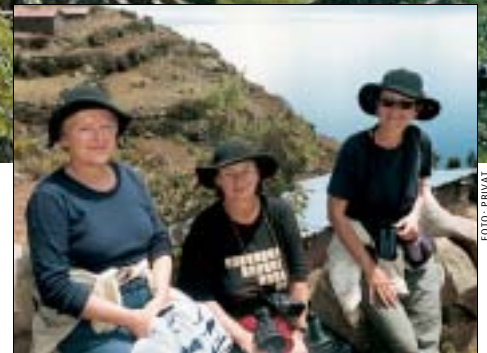
Tannlegedamer på tur.

Så fløy vi innenlands til Cusco, som er den gamle Inka-hovedstaden midt i EVENTYRET! Da vi landet, kunne jeg ikke begripe at spanjolene fant byen, for maken