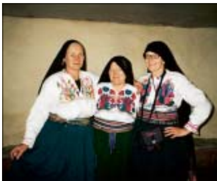
Her i den lokale bunad.

MACHU PICCHU • Så startet vår fottur til Machu Picchu, med frokost utafør huset til han med marsvinene. (Visste dere at på nattverdmaleriene i Peru er det et stekt marsvin som serveres. Vi tok sjansen på