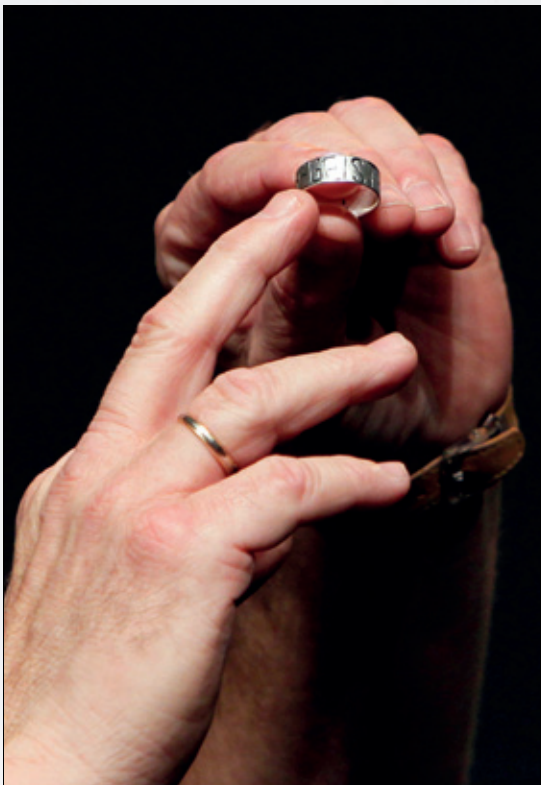
Per Anders Nordengen har både begeistring og giftering.

hvem som skal trekke i trådene og hvem som skal være hovedregissør i våre liv.